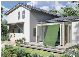
フォレストグリーン