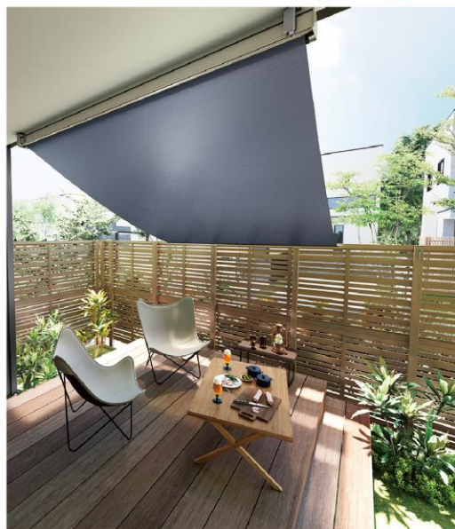
インディゴデニム