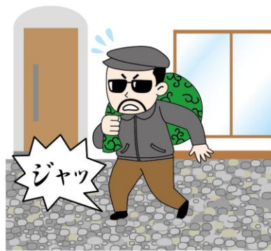
歩くとき大きな音がする防犯砂利というものもあります！建物の周辺に敷くと効果的です。

●「時間」…警察庁が窃盗犯からヒアリングしたところ、約7割が侵入に5分以上かかると断念するそうです。そのひとつに、鍵を開けるときに時間がかかることを嫌います。家の玄関や勝手口は「1ドア2ロック」が最適。補助錠や後付けできる電子錠を付けたリ、2ロックタイプのドアにリフォームする