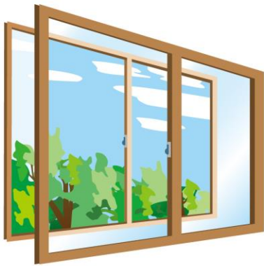
内窓の設置もおすすめ。窓を開けるのに時間を要します。

ことも手です。わずかなすき間にパイルを入れてドアをこじ開ける手荒なやり口もあるので、鎌付きのデッドボルト（カンヌキ）タイプの鍵への交換もおすすめ。最新のドアは不正解錠しづらい構造のシリンドアや、鎌付きデッドボルトを採用したタイプもあるので、相談してはいかが？ 窓も対策が必要。洗面所やトイレなど、小窓でも換気以外は施錠を。リビング以外の部屋の窓、特に2階の個室は高いところにあるので油断しがち。雨どいなどを使って上げることもあるため必ず施錠しましょう。 ワイヤー入りガラスの窓は防火目的で防犯ガラスではなく、たたき割っても飛散しにくいので、逆に狙われることがあるのだとか。そこで、2枚のガラスの間に特殊なフィルムを挟みこんだ窓がおすすめ。早急に対策をするなら補助錠が最適ですよ。