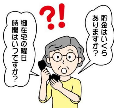
電話などで在宅状況や家族の状況、資産状況を聞かれてもむやみに答えないようにしましょう。

水道局では水道まわりの修理、依頼のない配管や水質の検査は行っていない。そのような訪問があったら、必ずインターホン越しに身分証の確認をしましょう。不意の訪問や電話に疑問や違和感を持ち、冷静になることが防犯につながります。 ほかに、合鍵の不正製作を防止するため、鍵は家族以外に見せたり渡したりしない、写真や動画に写り込ませないこと。自宅に必要以上の現金をおかないことも大切です。