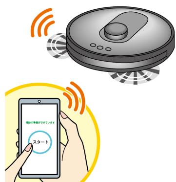
スマホと連動できるタイプなら、お出かけ中でもスマホからスタート！

以上の家でも各階に持ち運ばば掃除してくれるので、掃除の時間を軽減することができます。 ・掃除範囲によって機種を選べる…コンパクトな部屋を掃除するなら、一般的なタイプで十分。複数の部屋を掃除する場合は、部屋の間取りを認識できる内蔵のセンサーがついたタイプがおすすです。 ・拭き掃除ができるタイプも…ゴミを吸い込んだ後に拭き上げるため、雑巾がけの手間が省けます。